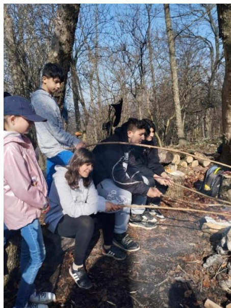
Šmolkové mestečko BA