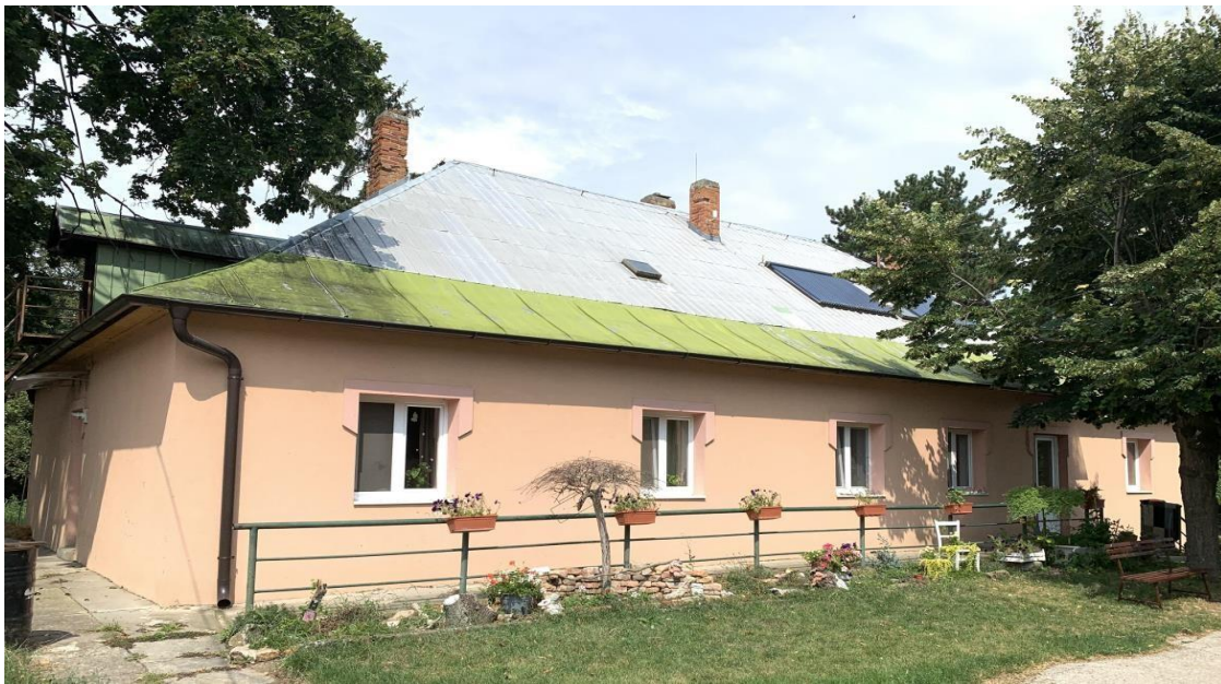
Samostatný domček v areáli kaštieľa

V samostatnom domčeku v areáli kaštieľa sú vytvorené podmienky na stretávanie sa detí s rodinou a blízkymi osobami, tiež na pobytovú prácu s rodinou a blízkymi osobami.