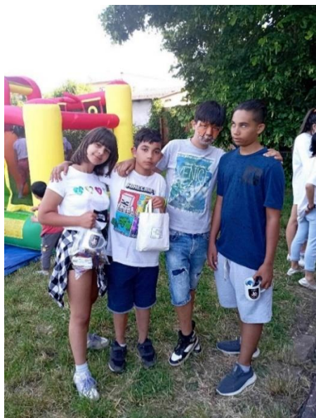
MDD v CDR Močenok